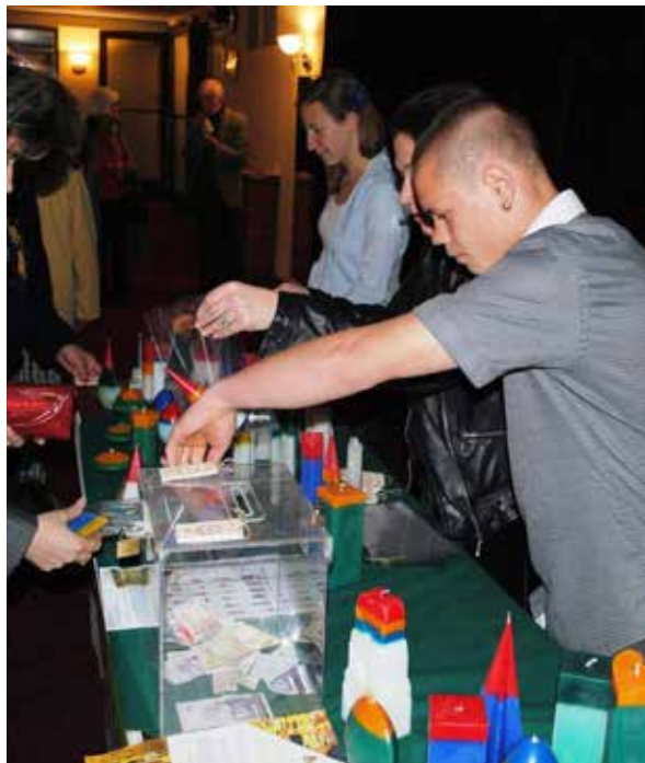
Зала България – 04.2015г.

На първите концерти в зала България отново имахме шанс да се представим, да наберем средства, както и да дадем възможност на младежите и юношите, включени в инициативата, да се докоснат до магията на класическата музика.