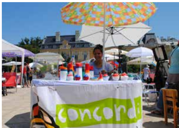
„Базар на изкуствата и творческите занаяти“ – Жълти павеа, 25.06.2015г.

Високите температури не попречиха на ентузиазма на нашите колеги и младежи да представят чудесните артикули, сътворени в ателие „Конкордия“.