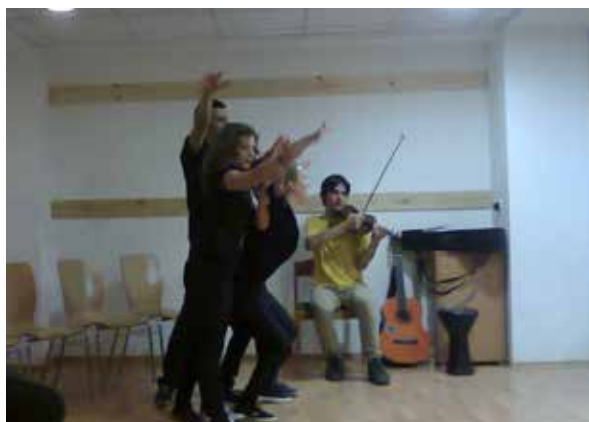
„Playback“ театър в Конкордия 20.11.2015г.

В два поредни дни (11-12.10.2015г.) отворихме щанд и в Централни Хали, София, където продавахме свещи и глиненни изделия произведени от деца и младежи в центъра.