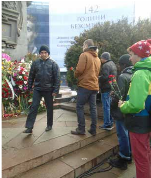
София, 19.02.2015г. – Паметник на Васил Левски

Младежите от Социален и младежки център „Св. Константин“ отгадоха почит пред паметника на Апостола на свободата Васил Левски, поднасяйки поклон и цвете в деня на 142 – та годишнина от обесването му (7 души).