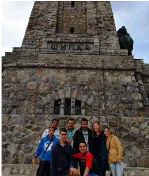
Шунка, 25.04.2015г., Храм-паметник „Шунка“

Посещението на паметника и последвалата кратка беседа за историята на върха събудиха интереса у младежите.