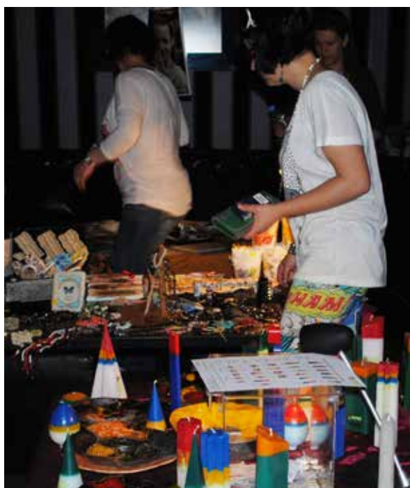
София Лайф клуб – 20.06.2015г. „Летен базар на изкуствата“

Отбелязахме празника Гергьовден с щанд на базар от поредицата „Базари на изкуствата и творческите занаяти“ в София Лайф клуб. Социален работник, доброволци към фондацията и младеж, изработил част от продукцията, показаха завидни търговски и презентационни умения.