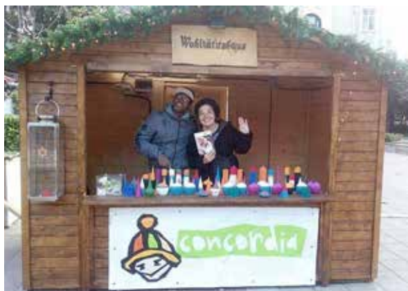
Немски коледен базар, гр. София и гр. Пловдив 11-12.2015г.

Актьорите от плейбек театър „Тук и сега“ помагат на младежите да погледнат себе си и живота от друг ъгъл.