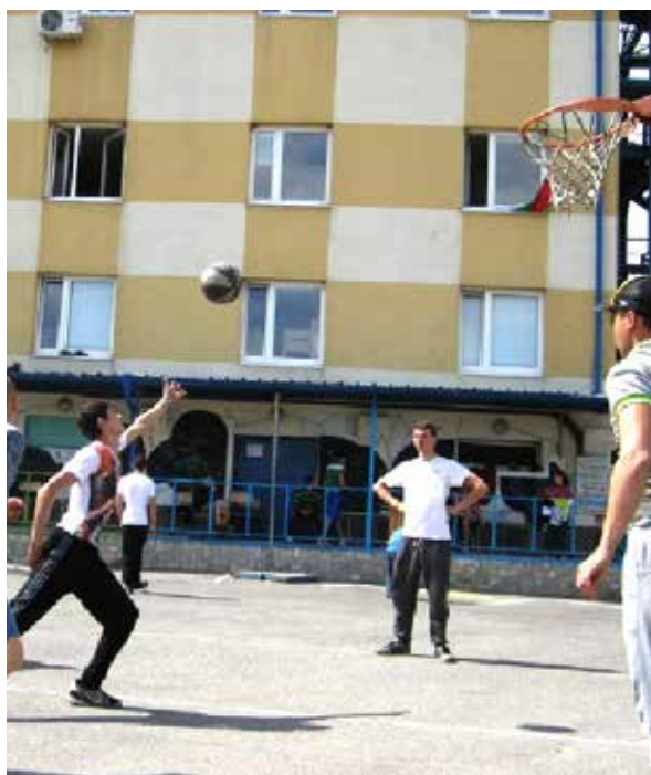
София, 18.04.2015г. , Баскетболен турнир – Социален и младежки център „Св. Константин“

Посещение в Карлово на Националния празник на България - 3-ти март сложи началото на поредица от еднодневни екскурзии на част от младежите от Фондация „Конкордия България“ до места, свързани с културно-историческото наследство на страната.