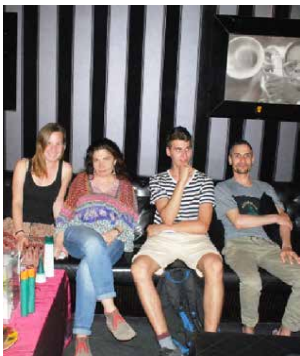
София Лайф клуб – 06.05.2015г.

На първите концерти в зала България отново имахме шанс да се представим, да наберем средства, както и да дадем възможност на младежите и юношите, включени в инициативата, да се докоснат до магията на класическата музика.