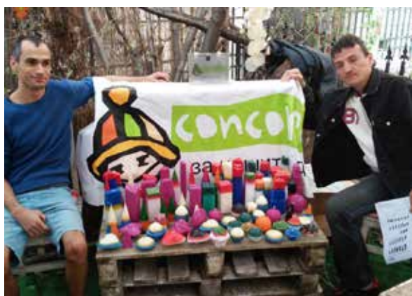
„Базар на изкуствата и творческите занаяти“ – Градински Арт Базар в La Casa Latina, 05.10.2015г.

Високите температури не попречиха на ентузиазма на нашите колеги и младежи да представят чудесните артикули, сътворени в ателие „Конкордия“.