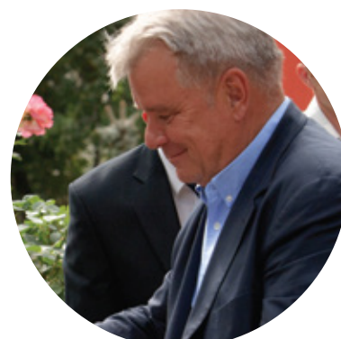
Hans Peter Haselsteiner