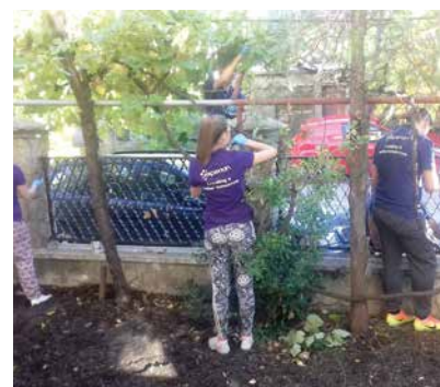
Корпоративни доброволци в ЦНСТ „Детска къща КОНКОРДИЯ“