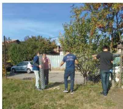
Корпоративни доброволци на футболно игрище