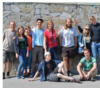
Международен обмен на доброволци между Конкордия България и Конкордия Румъния