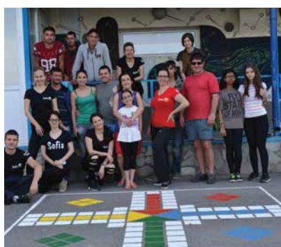
Акция за реновиране на двора на СМЦ „Св. Константин“