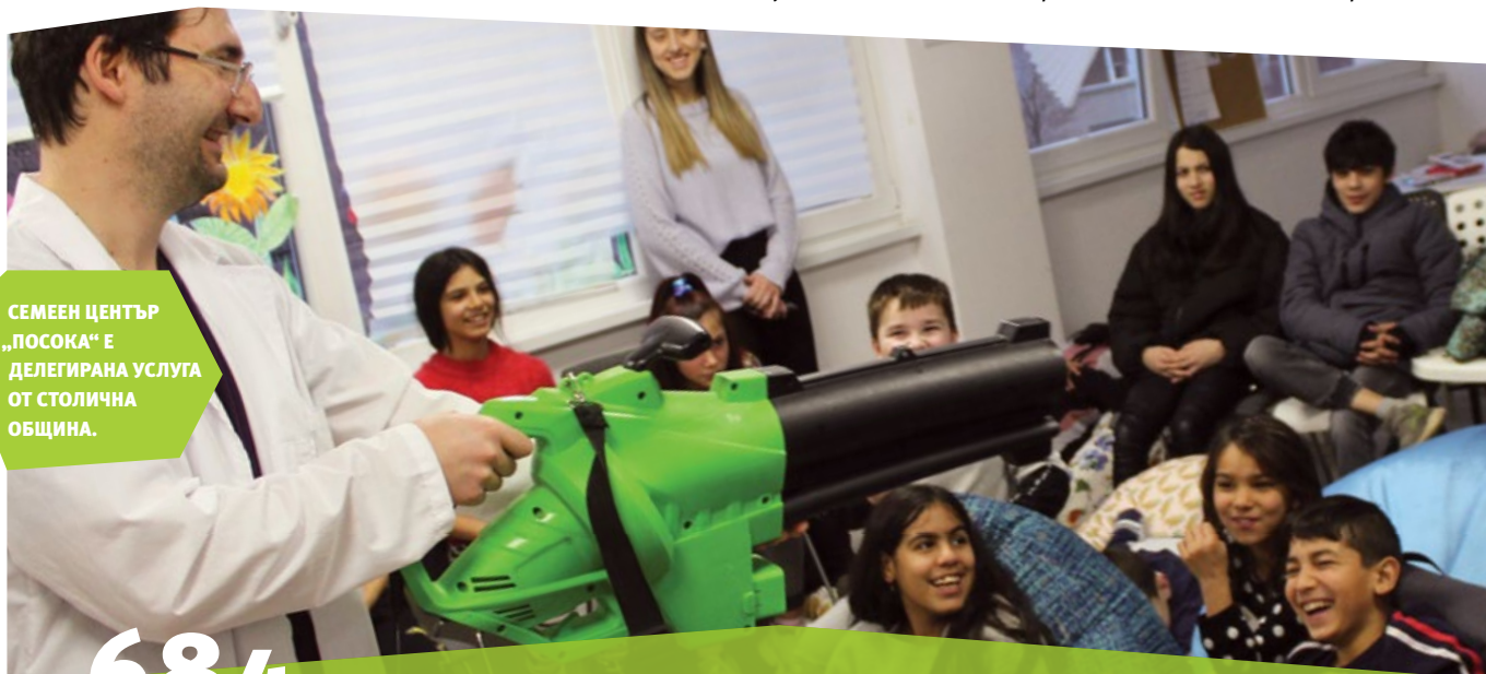
СЕМЕЕН ЦЕНТЪР „ПОСОКА“ Е ДЕЛЕГИРАНА УСЛУГА ОТ СТОЛИЧНА ОБЩИНА.

С децата в тийнейджърска възраст работата е насочена към формиране на умения за самостоятелен живот – информиране и консултиране с цел развитие на умения за търсене на работа, финансова грамотност, умения за оползотворяване на свободното време.